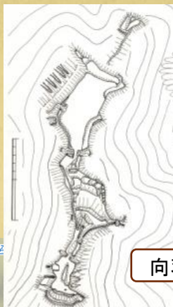
山ノ内氏の城「玉縄城跡」金山町川口