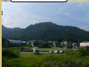
只見の要害山にある「水久保城跡」只見町