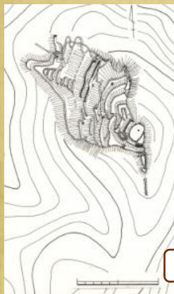
山ノ内氏の本拠「中丸城跡」金山町横田

会津には約五百もの城館跡があります。山城の代表は、会津美里町本郷の「向羽黒山城跡」。平城の代表は会津若松市の「神指城跡」です。